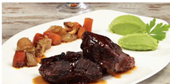
Guancia di Vitello

Guancia di Vitello in salsa di verdure. Gonzalier vigneti delle Dolomiti