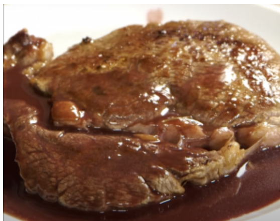
entrecote al vino Nambrot IGT Costa Toscana

viene preparato rosolando la carne, passandola in forno e realizzando la salsa con il vino.